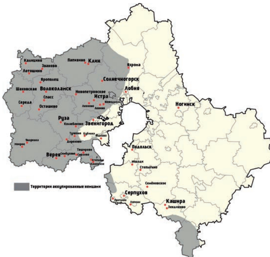
Рисунок 1. Населённые пункты воинской доблести на карте Московской области Figure 1. Military Valor Localities on the Moscow Oblast Map

Как видно по карте, наиболее интенсивная фаза Битвы за Москву проходила в следующих районах: Волоколамский, Наро-Фоминский, Рузский, Клинский, Можайский, Красногорский и другие округа. В большинстве случаев речь идёт о населённых пунктах, которые находились на оккупированной или прифронтовой территории в 1941 году, и освобождение которых стало частью масштабного контрнаступления Красной армии в декабре 1941 — январе