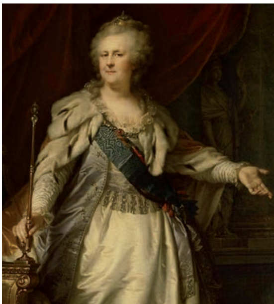
Figure 4. Portrait of Catherine the Great, 1793

Жалобы Суворова на «праздность» были обычным делом, но к этой государыня отнеслась внимательно потому, что дела в Польше и Литве шли