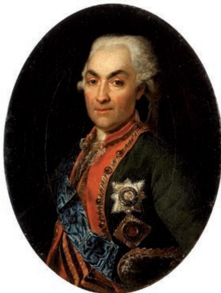
Рисунок 5. Портрет генерал-аншефа Н.В. Репнина, 1792 год 6 Figure 5. Portrait of General-in-Chief N.V. Repnin, 1792

Почти месячное стояние в Бресте полководец употребил на тренировки, побиение еще одного крупного отряда повстанцев, а главное — на сбор войск в один кулак. Русских частей и подразделений по Литве было разбросано много, а генерал-аншефов всего два — Суворов и Репнин. Поскольку последний ничего не делал, командиры должны были подчиняться не скупившемуся на приказы Суворову. Стягивая все войска к себе, полководец полностью опровергал свою же систему умиротворения повстанческих районов, разработанную им в прошлой войне. Однако к 6 октября под его началом был уже корпус в 25 тысяч солдат: основа для наступления на главные силы противника у Варшавы, безотносительно к планам пруссаков и австрийцев. «К содействиям на пруссаков надежды нет, — написал он Репнину, — австрийцы малосильны» (10, т. III, № 402).