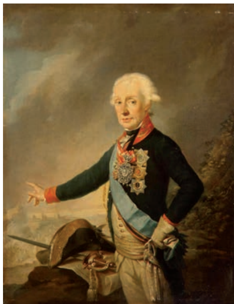
Figure 7. Portrait of Field Marshal A.V. Suvorov, 1799.

Рисунок 7. Портрет фельдмаршала А.В. Суворова, 1799 год 8