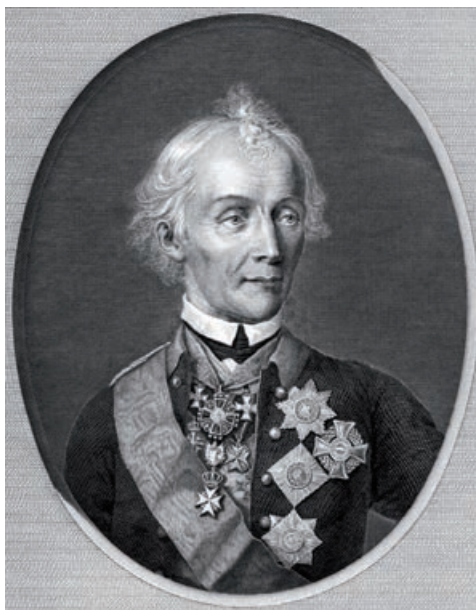
Figure 1. Portrait of A.V. Suvorov, painted by Schmidt from life in Prague in 1800, engraving by Utkin, 1818

Рисунок 1. Портрет А.В. Суворова, писанный Шмидтом с натуры в Праге в 1800 г., гравюра Уткина 1818 2