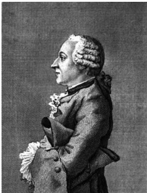
Рисунок 2. Гравированный портрет Ф.М. Гримма, 1813 3 Figure 2. Engraved portrait of F.M. Grimm, 1813

Полководец сформулировал для потомков идею польской кампании 1794 года вполне определённо. Так, 7 марта 1800 года, вернувшись из Итальянского и Альпийского походов в Кобрин, Александр Васильевич охарактеризовал ее специфику в письме к своему, а также Екатерины Великой (4) и дюжины западных монархов давнему, с 1795 года корреспонденту (11, № 516, с. 294), в то время русскому резиденту в Готе барону Фридриху Мельхиору Гримму (11, № 684, с. 385-388). Перед тем как чётко раскрыть военную логику кампании 1799 года, в результате которой из-за предательства союзников «гора родила мышь», Суворов на французском языке, которым, как и немецким, владел в совершенстве, описал свою тактику и перешел к стратегии: