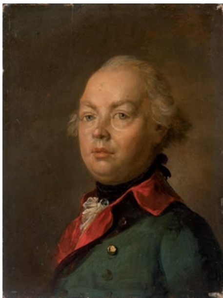
Figure 3. Portrait of Field Marshal P.A. Rumyantsev-Zadunaisky, early 1790s

У Суворова были и личные обстоятельства, способствовавшие спасению им Польши от многолетней резни. К 10 мая 1794 года испарилась перспектива войны с Османской империей (8, с. 331), план которой Суворов тщательно готовил (2, с. 319-321), а сам полководец поступил под начало командующего войсками на Юге России фельдмаршала П.А. Румянцева (10, т. III, № 317, 321), то есть остался не у дел, при строительстве некоторых укреплений на турецкой границе (10, т. III, № 322) и исполнении разовых поручений. В конце мая быстро расформировал польские войска на западной границе, в Брацлавской губернии (10, т. III, № 327, 329, 330), а уже 13 июня просил Румянцева «извести» его из «томной праздности»: «Мог бы я помочь окончанию дел в Польше и поспеть