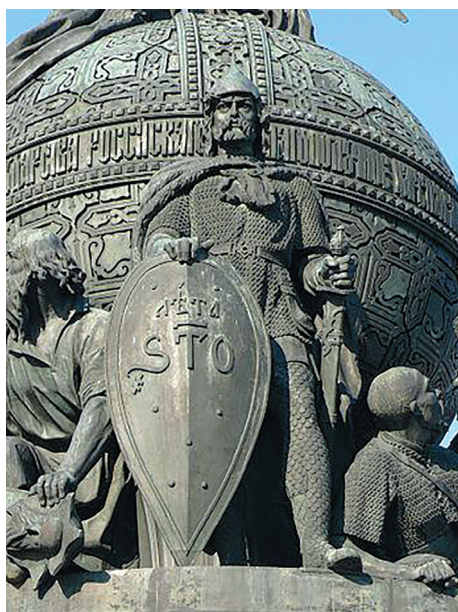
Рисунок 1. Рюрик на памятнике тысячелетия России Figure 1. Rurik on the monument to the millennium of Russia

обозначения морских разбойников, которые действовали в прибрежных водах, прячась в бухтах, заливах, губе. Хотя большинство викингов были выходцами из скандинавских стран Дании, Норвегии, Швеции, в сагах упоминаются имена викингов также из Польши, Германии, Шотландии. Экспансия викингов в VIII—XI веках была направлена в основном к берегам Европы, на земли Франции, Британии (Англии), Исландии, Шотландии, в Средиземное море. В 860 году викинги открыли Исландию, а с 874 года началось её заселение. Отсюда уже в 877 году была открыта Гренландия, подчеркивал специалист по истории скандинавских стран К.Ф. Тиандер (1873-1938), доктор исторических наук (25, с. 51-52). Викинги первыми из европейцев посетили Винланд — Америку. Важно понять, что Рюрик не имел даже малейшего отношения к викингам, которые открыли Гренландию, Америку, не был норманном (датчане, норвежцы, шведы), а был пришлым варягом из прибалтийской руси, приглашенным новгородскими славянами.