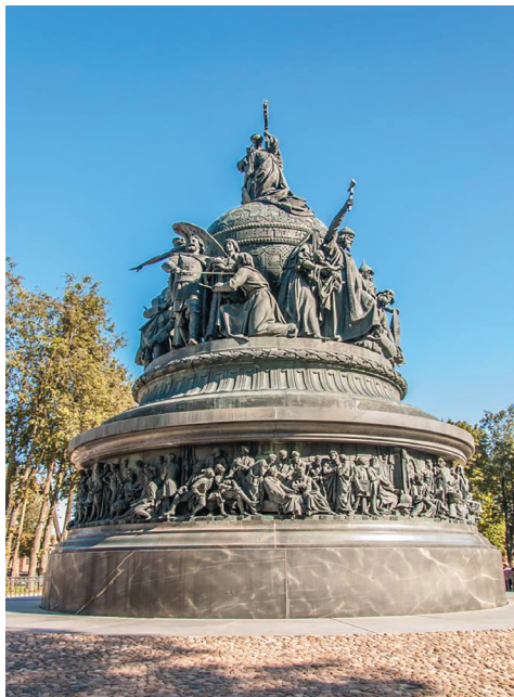
Рисунок 2. Памятник «Тысячелетие России» 16 Figure 2. Monument “Millennium of Russia”

Отечественная государственность начинается с известной в летописании, документально доказанной в исторической литературе династии Рюриковичей, которая правила в Великом Новгороде в 862-1136 годах и Новгородской вечевой республике в 1136-1478 годах, в Киевской Руси в 882-1240 годах, а затем в Московском княжестве с XIII века и трансформировалась в Московское царство до начала XVII века. Напоминает об этом, и всех нас, всю страну объединяет один из самых почитаемых памятников «Тысячелетие России». Его авторами были художник М.О. Микешин (1835-1896) и скульптор И.Н. Шредер (1835-1908). Коленопреклоненная женщина на шаре олицетворяет Россию, которую осеняет крестом крылатый ангел. Шар символизирует державу, стоящую на вечевом колоколе. Всего на